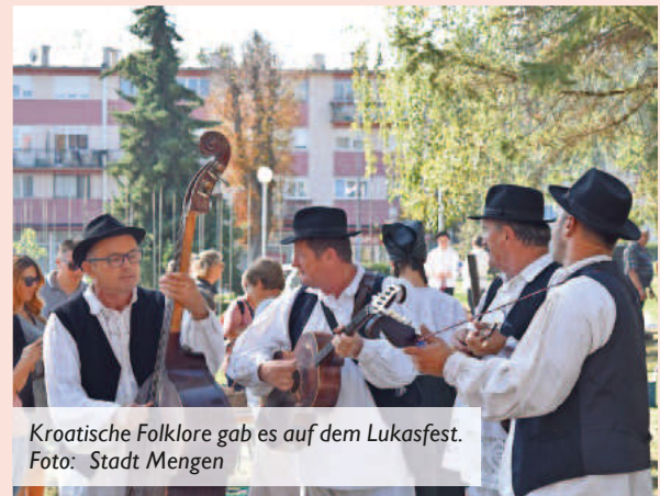
Kroatische Folklore gab es auf dem Lukasfest.