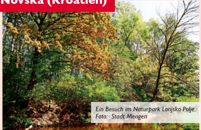
Ein Besuch im Naturpark Lonjsko Polje.