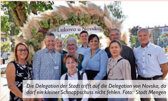
Die Delegation der Stadt trifft auf die Delegation von Novska, da darf ein kleiner Schnappschuss nicht fehlen.