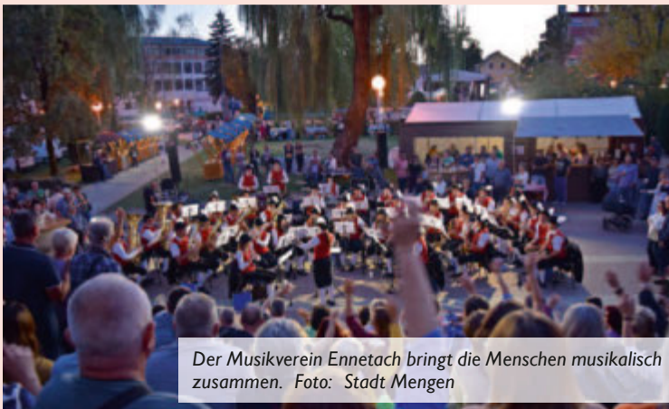
Der Musikverein Ennetach bringt die Menschen musikalisch zusammen.