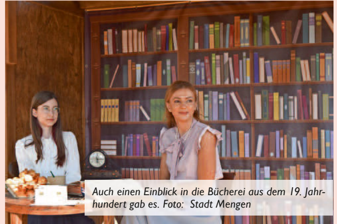
Auch einen Einblick in die Bücherei aus dem 19. Jahrhundert gab es.